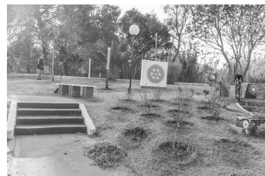
Limpeza rosedal - Barrio Centro