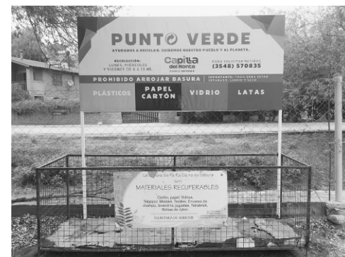
Instalación de puntos verdes en distintos lugares de la ciudad.