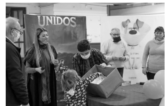
Sorteo de bicicletas en el festejo del Día de la Niñez

● Se incorporaron 6 ETP (entrenamiento para el trabajo) con inicio