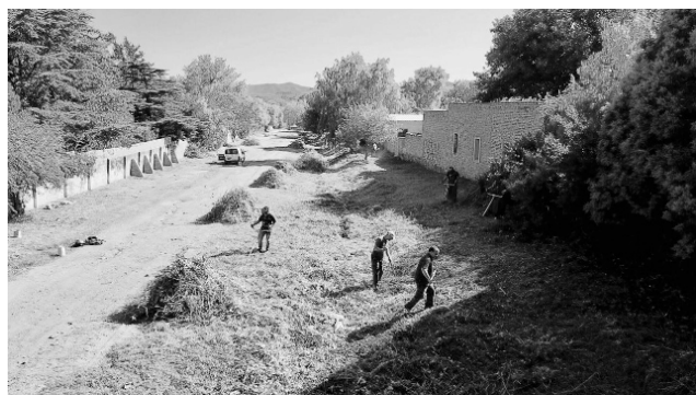
Limpeza del terreno lindante a las vías