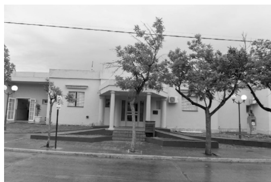
Recuperación de la fachada del Hospital Oscar Américo Luqui