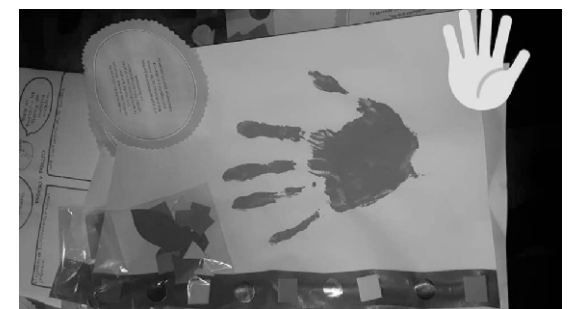
Entrega de actividades socio pedagógicas en Sala Cuna

correspondiente para el armado de 1.107 módulos que se entregaron el 26/12/2019, a 2 semanas de haber comenzado la gestión.