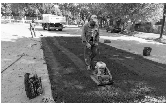
Se realiza un mantenimiento constante de calles de tierra, agregando material y pasando máquinas, para reparar los daños y el deterioro, como así también se repararan constantemente calles de asfalto.