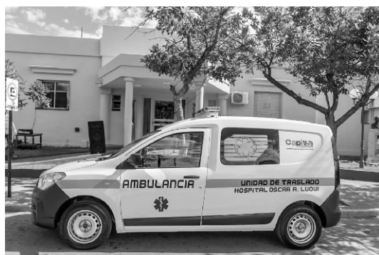
La nueva Unidad de Traslado del hospital Oscar A. Luqui

● Instalación de una sala de atención segura para pacientes febriles con