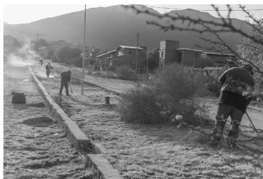
Limpieza Bv. Los Talas. - Barrio Valenti