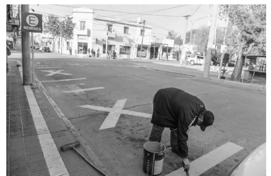
Señalización parada remises- Barrio Centro