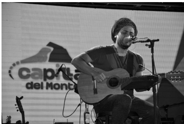
El cantante Rally Barrionuevo fue uno de los espectáculos de la temporada 2020