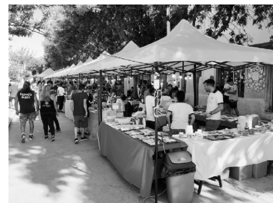
Festiva Siembra 2020