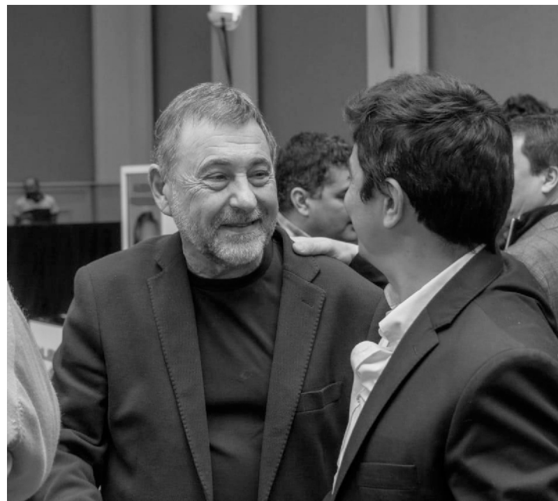
El Senador Nacional Carlos Caserio junto al Intendente Municipal Fabricio Díaz

Otro de los proyectos que están en carpeta para el 2021, es el de la remodelación de la actual terminal de ómnibus de la localidad, para lo cual se destinarán $11.000.000 y $40.000.000 más para la construcción de una terminal destinada exclusivamente a colectivos de larga distancia, en la parte sur de la ciudad.