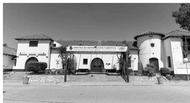
A solicitud de la Junta Municipal del Historia, se recuperó la fachada de la Estación del Ferrocarril, que forma parte de nuestra historia.

● Se implementaron en el salón de atención al público de la municipalidad las medidas de prevención COVID 19: alcohol en gel, termómetro y policarbonato en los escritorios.