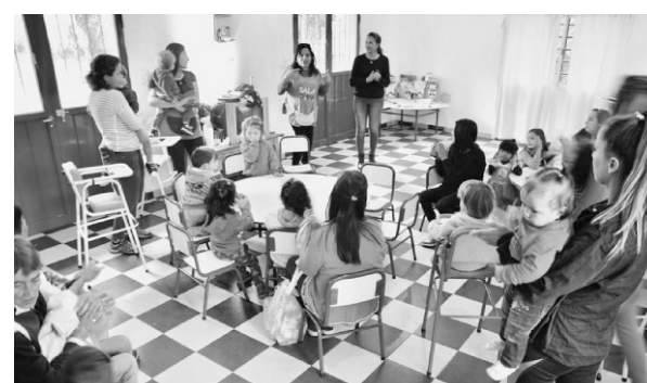
Trabajo en Sala Cuna al cuidado de niños y niñas

*Reorganización y remodelación del edificio