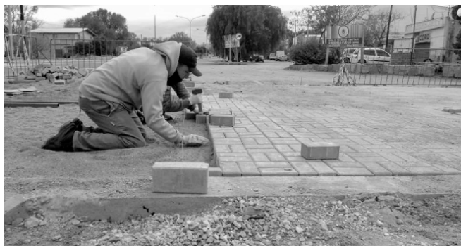
Se colocaron plataformas de adoquines en dos intersecciones de la Ruta 38, sobre las Calles Salta y Figueroa Alcorta, que en ambos casos evitan que se rompan los ingresos en períodos de lluvias.