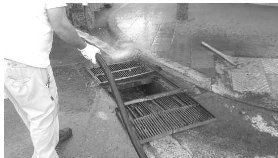
Limpieza de cámaras de desagües pluviales en las calles céntricas de la ciudad.