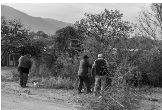
Limpieza calle Córdoba - Barrio El Zapato