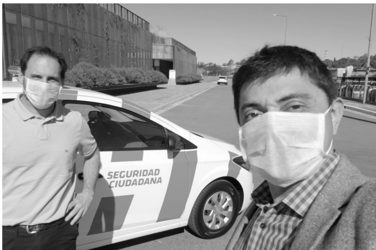
Adquisición del móvil de Seguridad Ciudadana