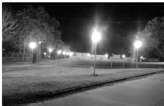
Iluminación y puesta en valor de la Canchita del Tala