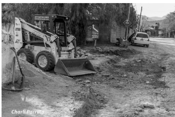
Construcción badén barrio La Toma