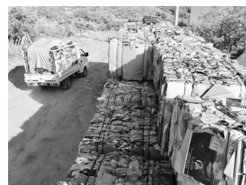
Se vendieron más de 12.000 Kg. de material reciclado