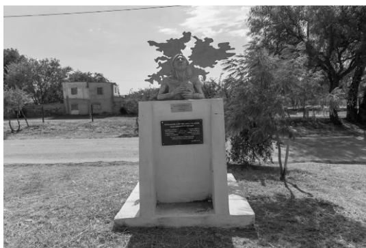
Puesta en valor de la plazoleta Héroes de Malvinas en barrio Balumba