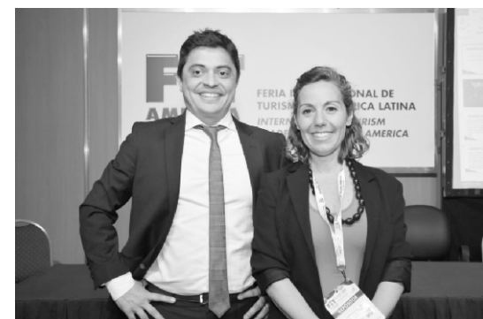
El Intendente Fabricio Díaz y la Secretaria de Turismo Gabriela del Río en la Feria Internacional de Turismo 2019