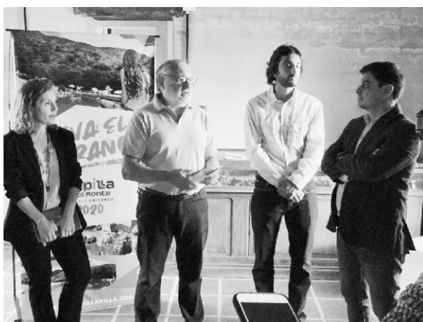
Lanzamiento ¡Viva el Verano!