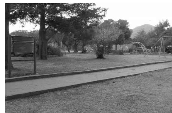
Puesta en valor de las plazas barriales