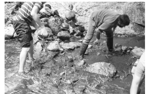
Limpieza del río Calabalumba