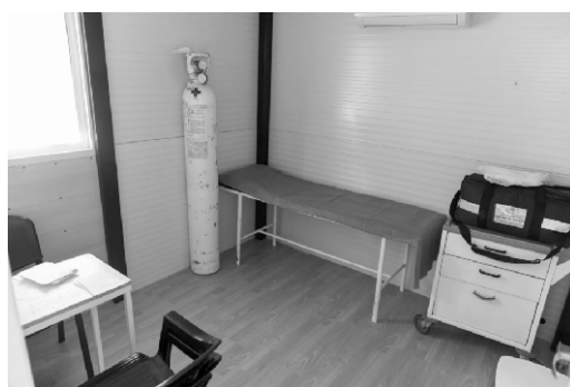
Nuevo consultorio de febriles

problemas respiratorios fuera del edificio del Hospital.