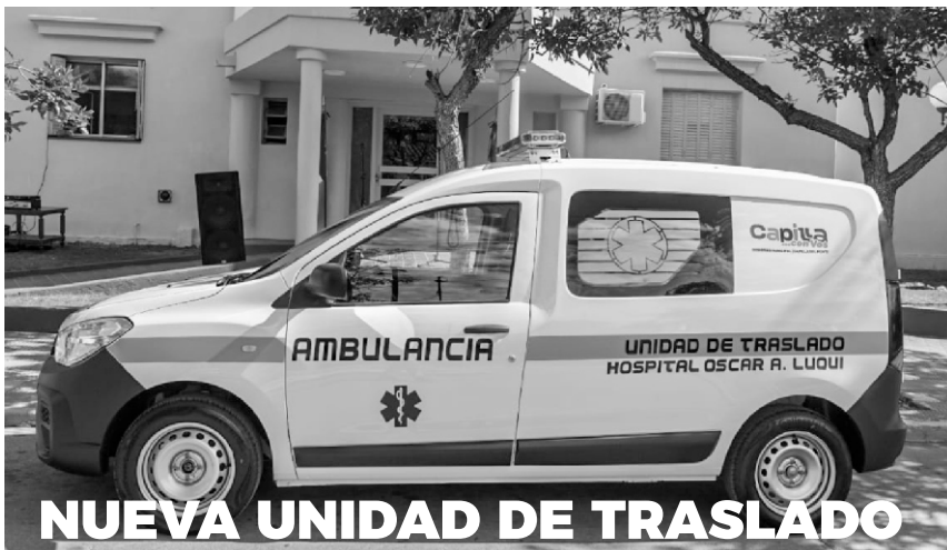
NUEVA UNIDAD DE TRASLADO