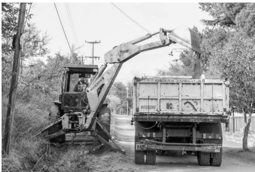
Limpieza calle Beruti - Barrio La Toma