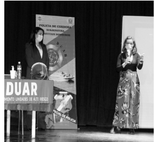
Capacitación del COE Regional para prestadores turísticos