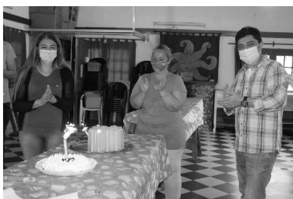
Aniversario del Comedor de Adultos Mayores y Personas con Capacidades Diferentes