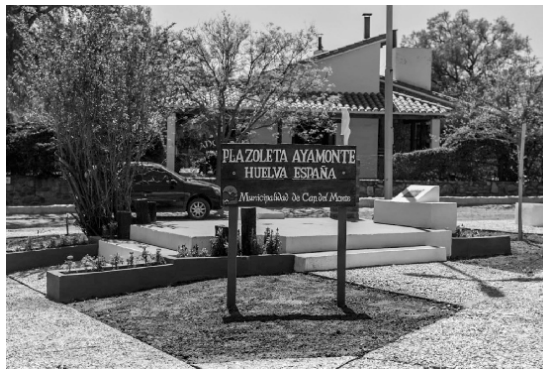
Remodelación plazoleta Ayamonte en el barrio La Banda

● Hasta la fecha se intervino en los Barrios Zapato Norte, Zapato y 9 de Julio, y de manera progresiva se irá cumpliendo con el cronograma proyectado que abarca la totalidad de los barrios.