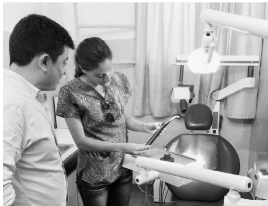
Nuevo consultorio de odontología

luminiscencia, hisopado naso faríngeo e hisopado naso faríngeo rápido.