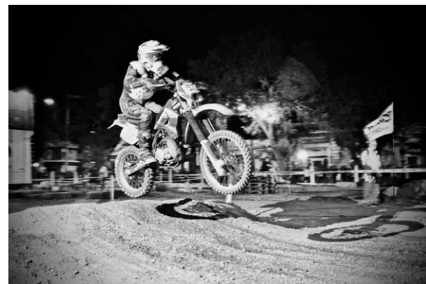
Exhibiciones de Moto Cross en la temporada 2020