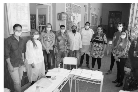
Entrega de las Tarjetas Alimentar en Capilla del Monte

hijo que debían asistir al Hospital Gutierrez por intervención quirúrgica.