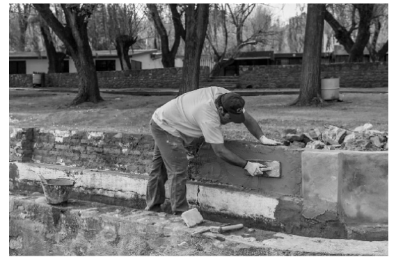
Refacción piletas del Balneario Municipal