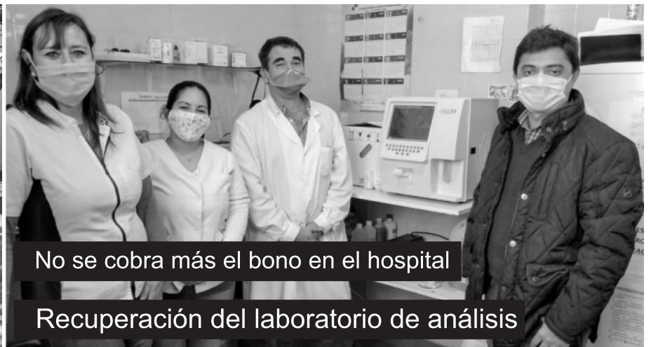
No se cobra más el bono en el hospital