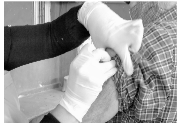
Campaña de vacunación contra la gripe